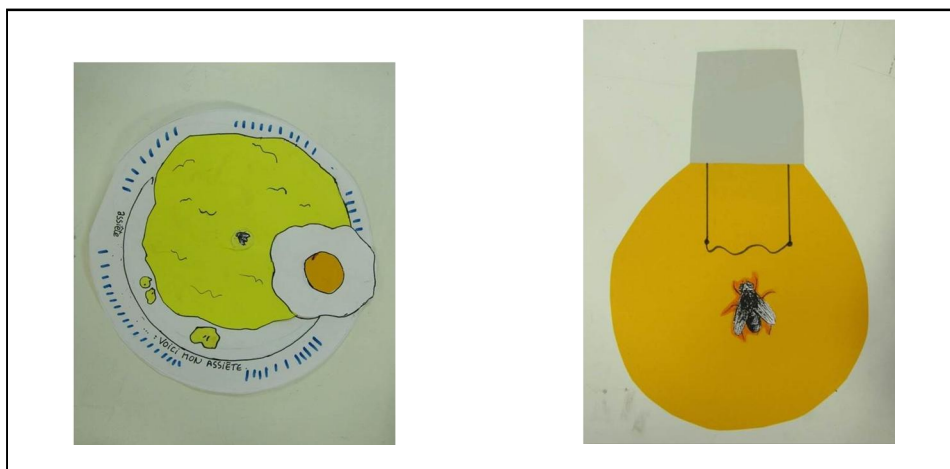
Figure 2. Des mouches bien proportionnées.