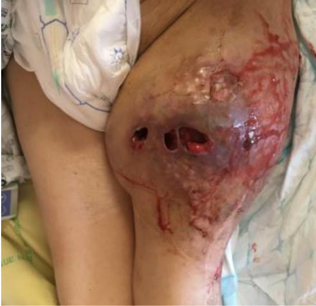
Figure 1. Masse de la cuisse gauche avec écoulement séro-hématique et nodules de perméation cutanée