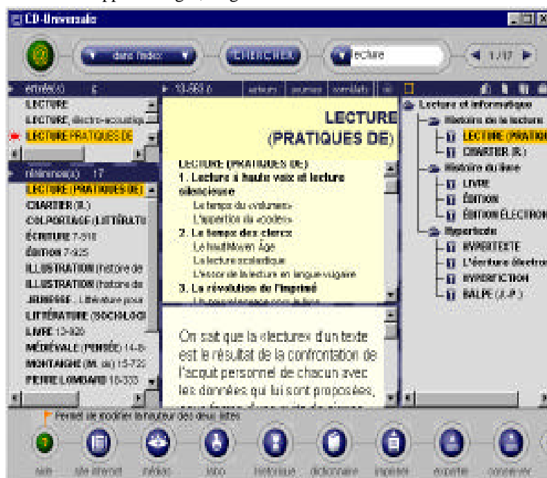
Écran avec la version 4 (en cours de recherche)

haut de l'écran, avec, à côté, un menu déroulant pour choisir les modes d'accès ; un panneau latéral gauche où sont présentés les résultats obtenus (liste d'entrées de l'index et titres d'articles) ; un panneau central où s'affiche le texte de l'article sélectionné pour la lecture ; un panneau latéral droit où se trouvent les icônes des fonctions d'archivage et de classement (le panier), d'exportation en traitement de texte et d'impression, complétées par une icône pour la fonction « historique » (liste des documents consultés) et, dans la version 4, d'une icône permettant d'activer un dictionnaire et d'obtenir, en cours de lecture, des définitions simples de tous les mots, ainsi que d'un renvoi à un site Internet. 5 Il apparaît clairement dans ce descriptif que la mise en scène des éléments fonctionnels dessine un scénario riche de parcours de découvertes et d'apprentissages, au gré du lecteur.