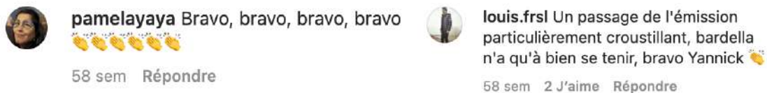
Figure 1 – Utilisation de l'emoji d'applaudissement sur Instagram

Sur Instagram et YouTube, contrairement à ce que l'on peut observer sur Twitter, la multimodalité – le fait de disposer de plusieurs formes technolangagières – est peu exploitée. Sur Twitter en effet, la diversité sémiotique des commentaires s'exprime dans 82% des tweets qui comportent plusieurs signes paratextuels 6 . Les mentions (@), dans une perspective d'énumération ou d'interpellation, et un lien vers une photo sont des combinaisons fréquentes parmi les tweets observés. En revanche, seuls 5% des tweets comportent un lien vers un article de presse ou une autre source externe qui pourrait par exemple soutenir une argumentation. À une exception près, ces tweets publiés par des internautes, a priori différents, sont identiques, tant dans le contenu du tweet que dans l'article de 20 minutes vers lequel ils redirigent :