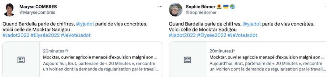
Figure 2 – Tweets identiques de militantes écologistes

Sur Instagram et YouTube, contrairement à ce que l'on peut observer sur Twitter, la multimodalité – le fait de disposer de plusieurs formes technolangagières – est peu exploitée. Sur Twitter en effet, la diversité sémiotique des commentaires s'exprime dans 82% des tweets qui comportent plusieurs signes paratextuels 6 . Les mentions (@), dans une perspective d'énumération ou d'interpellation, et un lien vers une photo sont des combinaisons fréquentes parmi les tweets observés. En revanche, seuls 5% des tweets comportent un lien vers un article de presse ou une autre source externe qui pourrait par exemple soutenir une argumentation. À une exception près, ces tweets publiés par des internautes, a priori différents, sont identiques, tant dans le contenu du tweet que dans l'article de 20 minutes vers lequel ils redirigent :