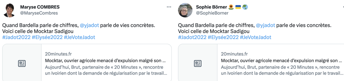
Figure 2 – Tweets identiques de militantes écologistes

Cet usage est régulier dans le corpus, et notamment de la part des soutiens au candidat écologiste. Le tweet ci-dessous apparaît lui aussi diffusé de manière strictement identique par huit utilisateurs qui semblent différents :