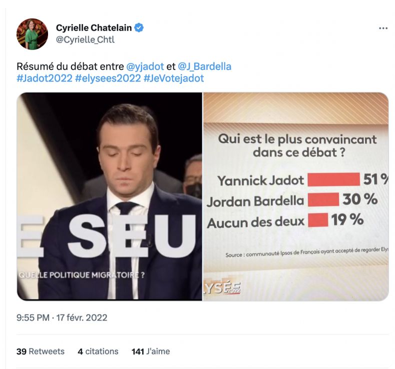
Figure 3 – Utilisation par une internautes du sondage réalisé en cours d'émission